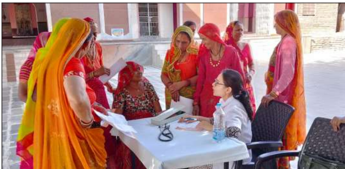
टीटी चैरिटेबल ट्रस्ट के सौजन्य से सुगनी देवी अस्पताल बीकानेर द्वारा निःशुल्क शिविर लगाया गया और इस शिविर का हज़ारों लोगों ने फायदा लिया।