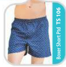
Boxer Short Ptd TS 106