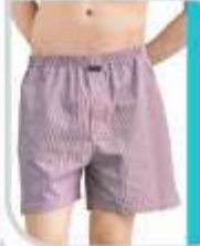
Boxer Short Check TS 105