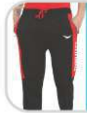
Classic Lounger TS 128