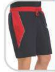
Classic Bermuda TS 130