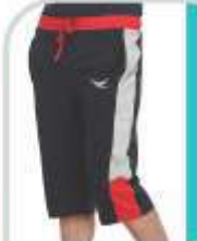
Classic Capri TS 129